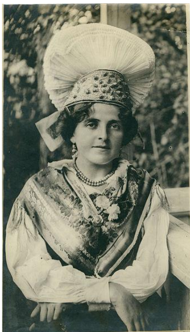
Gorenjska narodna noša

Če bi definicijo domovine poiskali v Slovarju slovenskega knjižnega jezika, bi bila razlaga: dežela, v kateri se je kdo rodil, v kateri prebiva . A v resnici ima domovina še globlji pomen, saj je dom, h kateremu se lahko vedno zatečemo in predstavlja del nas. Obstaja rek »Povsod je lepo, a doma je najlepše«, s katerim se ne bi mogla bolj strinjati.